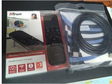
Ilustración 3 MANDO POWER POINT